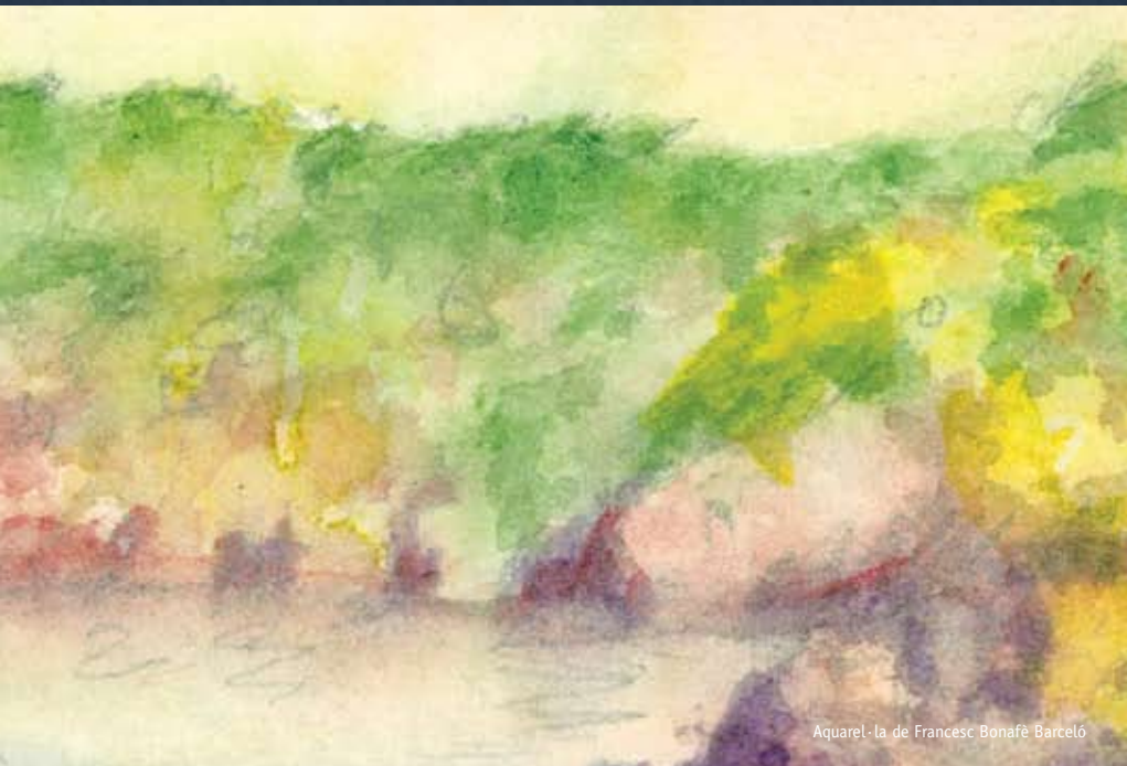
Aquarel·la de Francesc Bonafè Barceló

fins i tot, de mística poètica. Tot això, envoltats de plantes que ens donava a conèixer i que, de tant en tant, recollia delicadament per al seu herbari.