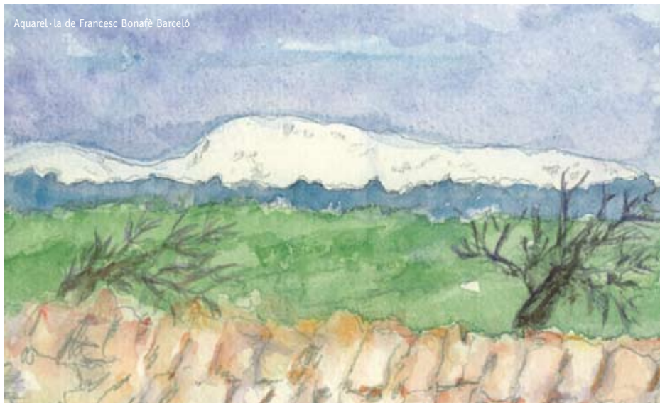
Aquarel·la de Francesc Bonafè Barceló

Després d'uns anys al Seminari Diocesà, va entrar a la Congregació dels Missioners del Sagrat Cor i el 1934 va ser ordenat prevere. Segons la gent que el conegué, fou un home contemplatiu, com el Blanquerna de Ramon Llull, que passà la seva vida com a religiós, entre l'ermita de Sant Honorat (Puig de Randa), el monestir de la Real, on cursà la seva formació teològica, el convent de Sóller i el Santuari de Lluc, on féu de professor d'Ensenyança Religiosa, de Literatura, de Llatí i de Ciències Naturals.