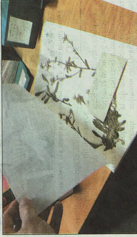
J.M.E. / Un dels fulls de l'herbari que ha estat cedit al Jardí Botànic.

produït per la humitat i altres elements”.